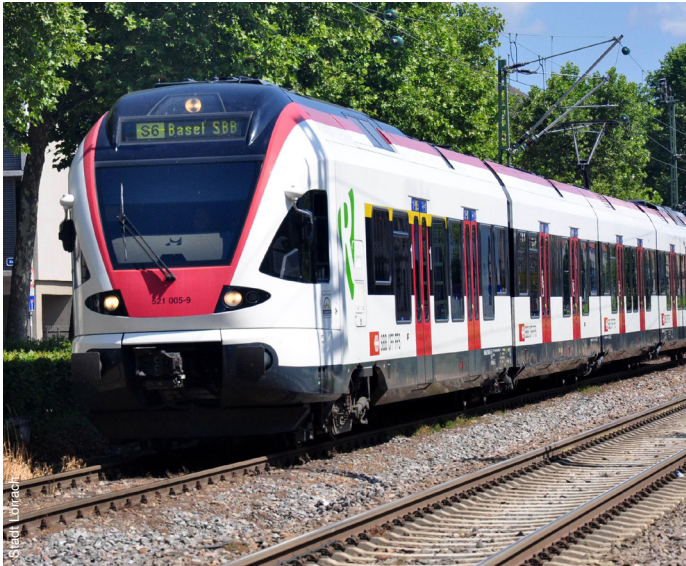
Die Regio-S-Bahn – neuer Haltepunkt an der Grenze Le Regio-S-Bahn – une nouvelle station à la frontière